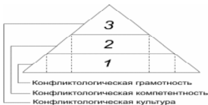
Рис. 1. Компоненты конфликтологической подготовки личности

— надежность—согласованность составила по формуле Спирмена-Брауна 0,81 и по формуле Кронбаха 0,79.