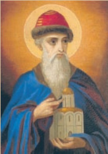
Владимир I Святой